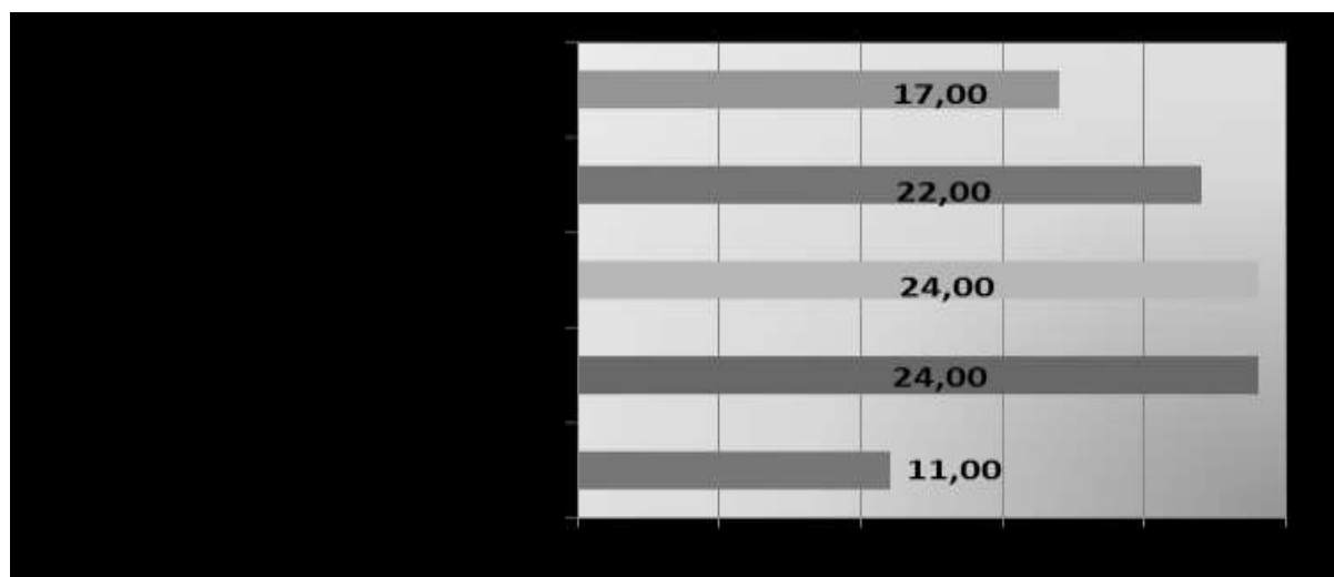
2. Ábra: Kompetenciafejlesztésre vonatkozó hallgatói elképzelések (% relatív gyakoriság, több válasz volt adható)